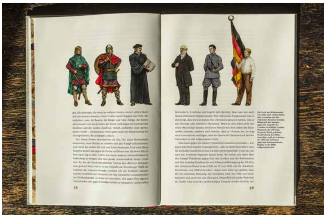
Karlheinz Weißmann: Martin Luther für junge Leser. Prophet der Deutschen, Berlin 2017, S. 18/19. Wie so eine Traditionslinie deutscher Helden in Weißmanns Augen aussieht, zeigt diese Bild-Konstruktion. Originalillustration: Sascha Lunyakov. Foto: BAG K+R (Hermann Bredehorst).

Darstellung der Reformationsgeschichte folgt daraus ein großer Schaden: die europäischen Zusammenhänge und globalen Wirkungen der Reformation werden fast vollständig ausgeblendet. So führt die Monumentalisierung zu Provinzialisierung und Verzweigung. Um das Profil von Weißmanns Lutherbild zu erfassen, sollte man die Illustrationen des Buches betrachten. Sie greifen die unhistorischen und heroisierenden Bildklischees des 19. Jahrhunderts auf, vergrößern diese und zeigen einen finster dreinschauenden, markig auftretenden Helden, der sich nur an Deutsche wendet – so ein doppelseitiges Bild, das einen jungen Luther zeigt, der wie ein Marktschreier Flugschriften