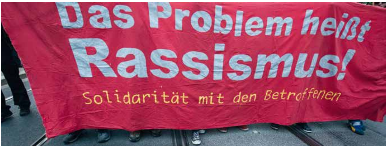
Am 17. Juni 2015 protestierten etwa 150 Menschen in Dresden auf einer Kundgebung des Bündnis Dresden Nazifrei. Der Protest richtete sich gegen einen Aufmarsch der NPD im Dresdner Stadtteil Leuben.

Im Mythos des gefährlichen Flüchtlings werden koloniale, rassistische und sexistische Denkmuster vermengt und Hetze gegen Geflüchtete betrieben. Gleichzeitig wird eine vermeintlich offene und nicht-patriarchale deutsche Mehrheitsgesellschaft konstruiert, die sich als aufgeklärt und »gut« imaginiert. Sexistische und rassistische Herrschafts- und Ausgrenzungsverhältnisse werden damit festgeschrieben. Eine Auseinandersetzung mit Gerüchten über sexualisierte Gewalt bzw. sexuellen Missbrauch muss sich daher immer beiden Ebenen widmen. Nachfolgend geben wir anhand der Diskussion von Fallgeschichten Empfehlungen, welche Reaktionen auf entsprechende Gerüchte sinnvoll und wirksam sein können. Grundsätzlich muss der Hetze gegen Flüchtlinge widersprochen und einer rechtsextremen Instrumentalisierung von Sexualstraftaten entgegengewirkt werden.